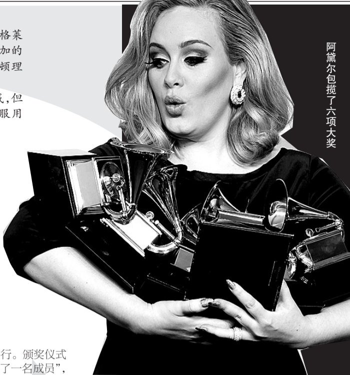
阿黛尔包揽了六项大奖

甜蜜的乡村歌手泰勒·斯威夫特不仅凭借《Mean》获得最佳乡村歌曲,还获得了瘦身之后的不分男女的最佳乡村歌手奖。 本报综合报道