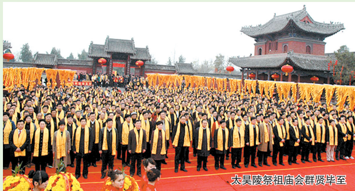
太昊陵祭祖庙会群贤毕至

每年的农历二月初二到三月初三,河南淮阳城北的太昊陵都会弥漫着冲天的香火。天南地北的香客循着香火而来,在摩肩接踵中向号称“天下第一陵”中的“人祖”顶礼膜拜,寻根问祖。 据悉,庙会期间,太昊陵都会人潮如流,有还愿的,有祭祖的,有逛会的,热闹非凡。人们提香捻纸从四面八方赶来,有的一步三叩头,有的甚至拖家带口。上香