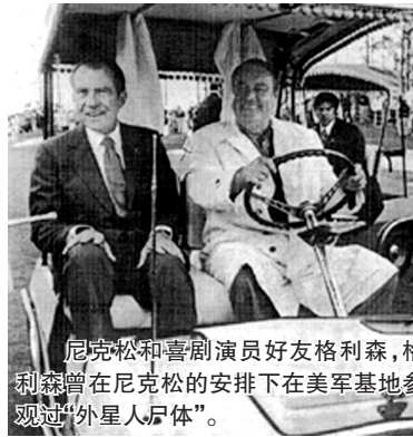
尼克松和喜剧演员好友格利森，格利森曾在尼克松的安排下在美军事基地参观过“外星人尸体”。

古德还披露，因“水门事件”而下台的美国前总统尼克松也知道外星人的存在，一次他曾秘密安排自己的好友、美国喜剧演员和音乐家杰基·格利森到佛罗里达州霍米斯泰德空军基地观看了一些外星人的尸体，据称格利森被他看到的东西惊呆了，他的精神受到了巨大的震撼。格利森已于1987年去世，格利森的前妻比弗莉·格利森3年前打破多年沉默，披露她和格利森离婚前，格利森的确向她披露过他在尼克松安排下在霍米斯泰德空军基地观看了外星人尸体的内幕。 阿尔编译