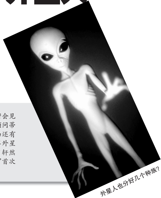
外星人也分好几个种族？

外星人也分“种族”，有白发蓝眼的，也有浑身发灰的 会谈在空军基地进行，一共见了三次 会谈内容是：以外星“先进科技”换取美国销毁核武器