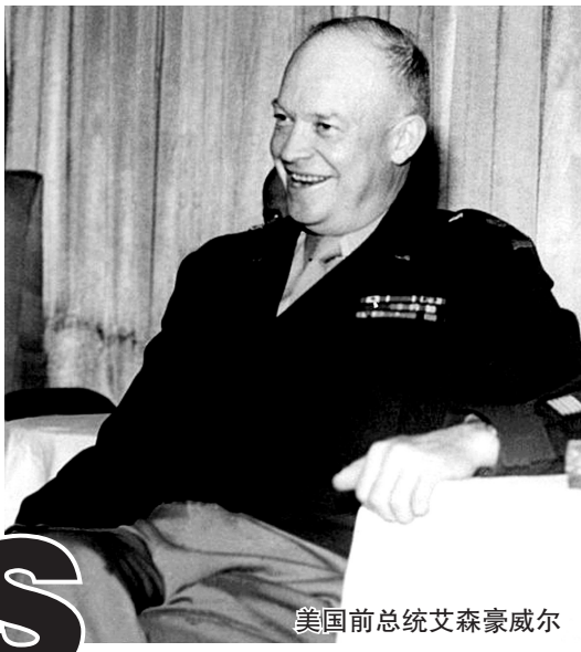
美国前总统艾森豪威尔