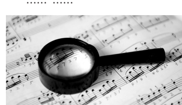
奶奶每天拿着放大镜,为孙女翻译五线谱。

2011年8月23日,在“2011上海国际青少年钢琴大赛”全国总决赛中荣获非专业院校组少年B组银奖。