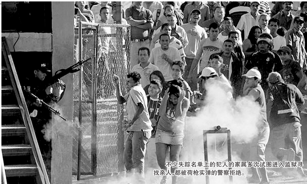
不少失踪名单上的犯人的家属多次试图进入监狱寻找亲人,都被荷枪实弹的警察拒绝。

综合报道,当地时间14日深夜,洪都拉斯中部地区一座拥挤的监狱发生大火,遇难人数已经升至357人。据信,这是拉丁美洲类似灾难中死者最多的一起。而愤怒的囚犯家属15日与当地警方发生对峙和冲突。