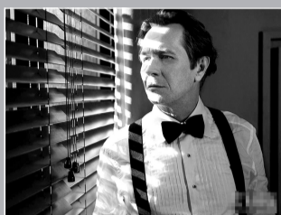
《锅匠、裁缝、士兵、间谍》