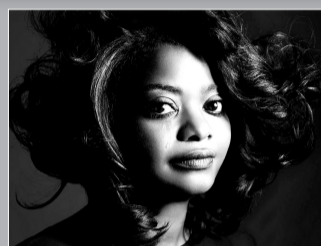
奥克塔维亚·斯宾瑟

维奥拉·戴维斯最大的竞争对手还有《铁娘子》里的梅丽尔·斯特里普,梅丽尔手里已经有两座小金人,她早已经用不着再用奖项来证明自己了,本着这样的逻辑出发,梅丽尔的胜算似乎不如维奥拉大。鲁妮·玛拉在《龙纹身的女孩》中也有精彩表现,但她入行时间并不长,这次陪跑的机会比较大。倒是另一位美貌的米歇尔·威廉姆斯,这位扮演梦露的女演员,入行19年,也该颁发个奖来表扬一下她,何况她饰演的梦露的确让人称赞。