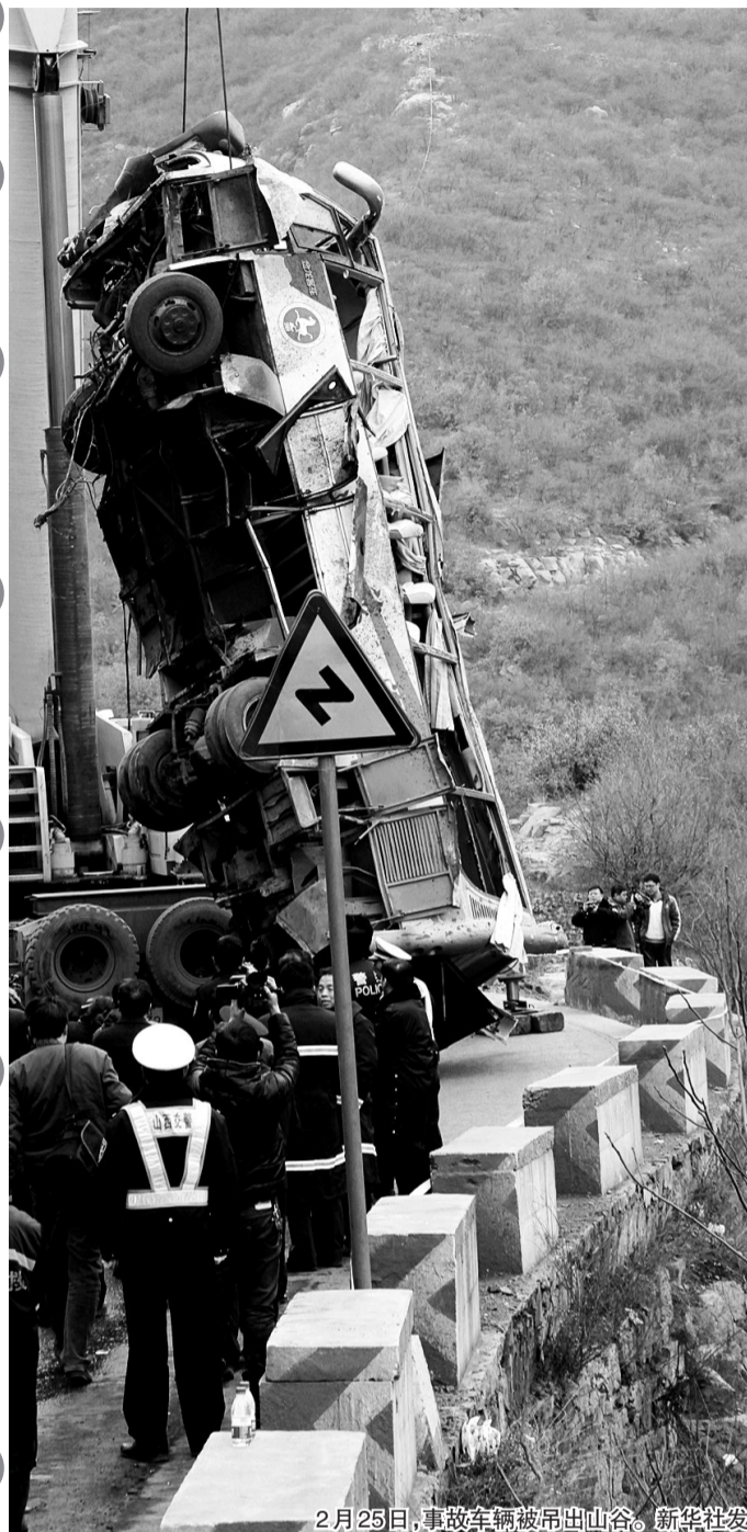
2月25日,事故车辆被吊出山谷。

山西省公安厅交管局局长边智慧:初步勘查就是驾驶员违规操作,在山区道路和急转弯道路上超车、超速,驾驶不当,造成了这起严重事故