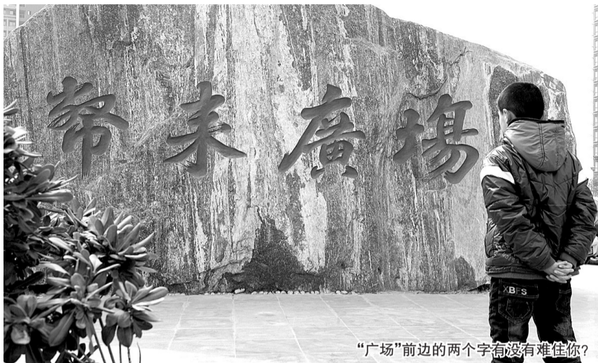
“广场”前边的两个字有没有难住你?

王师傅告诉我,这块石头立在这里好几年了,两年前他来上班时就立在那里了,是美景鸿城开发商放置的,他也搞不懂具体的意思:“从字面上看,可能是祝福的吧,币就是钱的意思,耒好像是像犁那样的农具,是不是犁出财富的意思?”