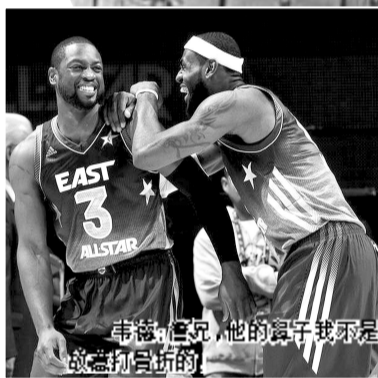
韦德:科比,他的鼻子我不是故意打骨折的

当晚对位防守科比并不慎把对手鼻子打骨折的热火队球星韦德夸赞说,科比真是一位“难以置信的得分手”,“我不知道他书写的那项纪录将会持续多久”。