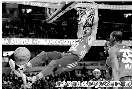
威少的暴扣让观众目瞪口呆

NBA总裁斯特恩也毫不忌讳他对林书豪的“宠爱”,直言“美国和中国都对林书豪给予了极大关注”,林书豪的球衣需求量现在已经是联盟第一。前NBA副总裁格拉尼克断言,“要求林书豪出门参加的活动肯定都顶破了天棚”。