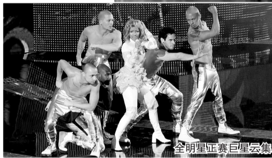
全明星正赛巨星云集,“麻辣鸡”劲歌热舞