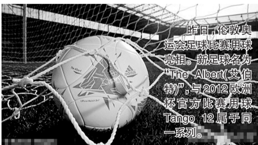
昨日,伦敦奥运会足球比赛用球亮相。新足球名为“The Albert(艾伯特)”,与2012欧洲杯官方比赛用球Tango 12属于同一系列。