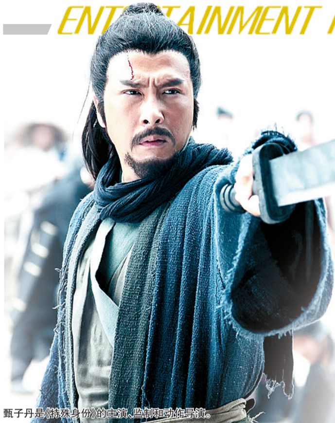
甄子丹是《特殊身份》的主演、监制和动作导演。