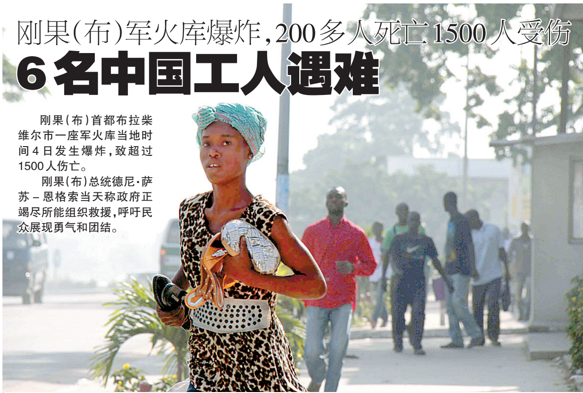
左图：当地惊恐的民众急匆匆逃离爆炸区。

刚果(布)总统德尼·萨苏-恩格索当天称政府正竭尽所能组织救援，呼吁民众展现勇气和团结。