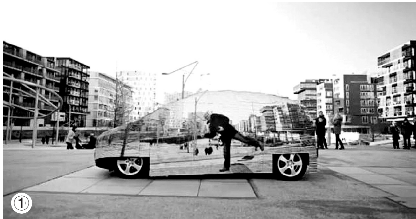
①②③摄像机拍摄下汽车乘员一侧的影像,影像实时呈现在驾驶者一侧,让F-Cell能够被看穿,进而达到隐形效果。

据国外媒体报道,哈利·波特和霍比特矮人佛罗多·巴金斯的隐形斗篷让所有人羡慕不已。试问,谁不想过一把隐形的瘾儿呢?现在,科学家已经能够让整辆汽车“隐形”。借助于光学伪装技术,奔驰公司的工程师制造出一种幻觉,让最新款零排放F-Cell奔驰消失于无形。