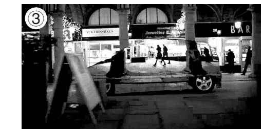
④工程师为汽车安装LED“毯子”