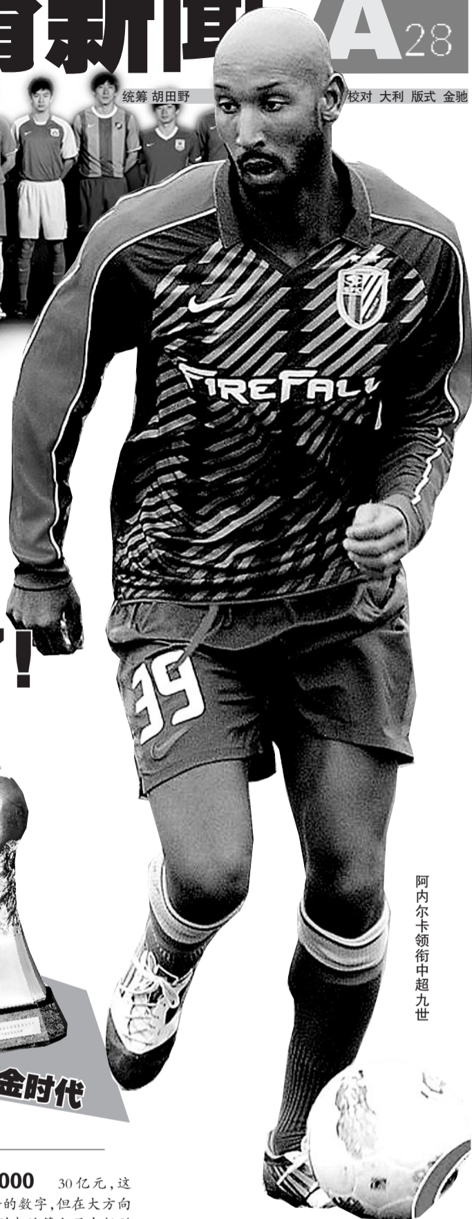
阿内尔卡领衔中超九世

无论如何，央视的再度参与，于“重新起步”的中超而言是一个好的起点，而有了央视这样一个平台，中超在又一次得以进入更多人的视野之后，能否真的给人带来更多快乐，甚至是狂欢，那还有赖于中超自身的努力。