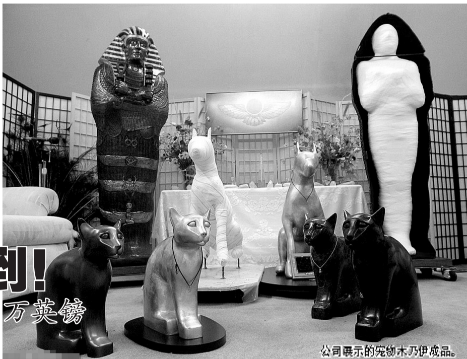
公司展示的宠物木乃伊成品。