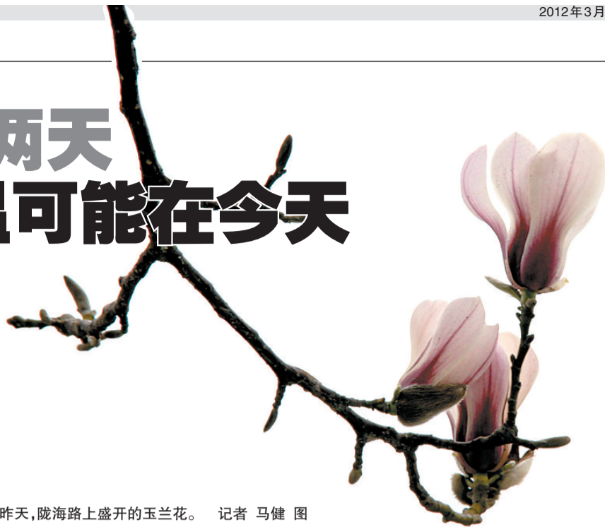
昨天,陇海路上盛开的玉兰花。

“星期二是不是17℃?我要穿裙子!”身边好友前几日便开始询问。没错的!今天市区最高气温继续攀升,预计在16℃~17℃。不过还是得提醒爱美的姑娘们,早晚温差较大,风