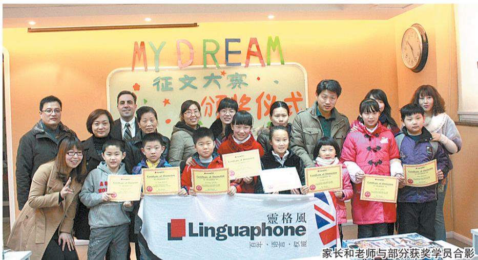
家长和教师与部分获奖学员合影