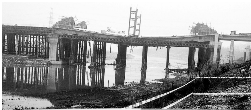
3月13日,湖南省娄底市涟水河大桥(二大桥)桥面发生断裂的事故现场拉起了警戒线。

3月12日21时40分许,湖南省娄底市吉星路涟水河大桥第十跨桥面在进行钢管拱施工时,81米长的桥面发生断裂。事故没有造成人员伤亡。