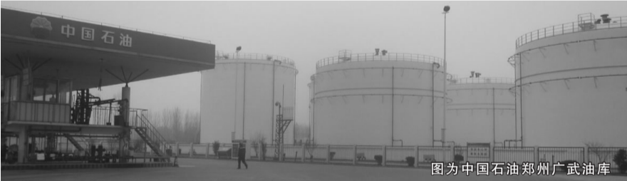
图为中国石油郑州广武油库

中国石油河南销售公司所属油库,一直以来秉承中国石油集团公司“质量、健康、安全”的经营理念,视质量为企业的生命,把质量保证作为企业发展的根本。