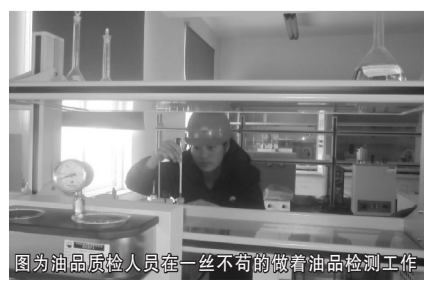
图为油品质检人员在一丝不苟的做着油品检测工作