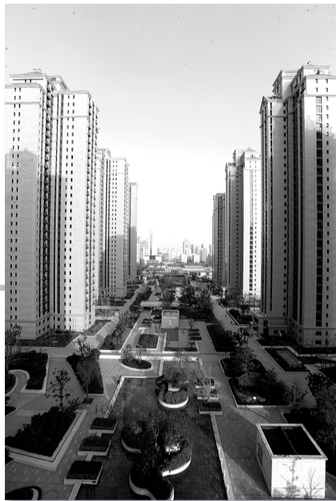
正弘·蓝堡湾项目效果图