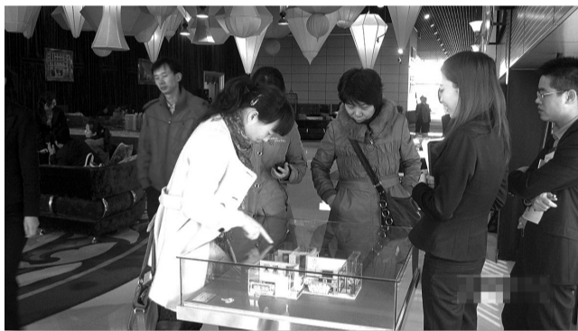
婚房代表到正弘·蓝堡湾现场体验。

户型特点: 科学规划居住格局,将空间利用到极致。入户直观户外景致,通透室内设计,彰显居住的最大舒适尺度;起居功能空间,别致划分华丽生活的华贵居所;厨卫双区分离,奏响都会生活中的悠扬乐章。既适合单身贵族的奢侈生活,也可满足二人世界的温馨浪漫。