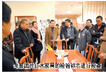
考察团对红木家具的检验标示进行检查