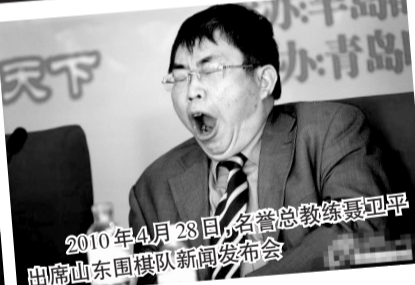
2010年4月28日,名誉总教练聂卫平出席山东围棋队新闻发布会