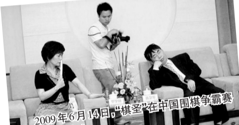
2009年6月14日,“棋圣”在中国围棋争霸赛杭州站见面会上