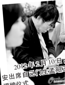
2012年2月10日,聂卫平在西安出席自己门生孟昭宝创办俱乐部揭牌仪式