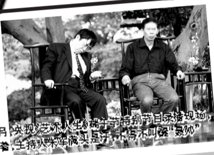
2009年5月,央视《艺术人生》端午特别节目录制现场,聂卫平几次睡着,主持人李咏满头大汗叫醒“棋圣”