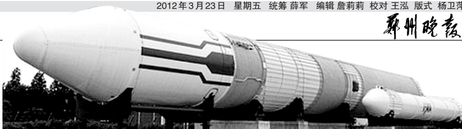
5月18日,H2A火箭将搭载着韩国的多功能观测卫星发射升空。