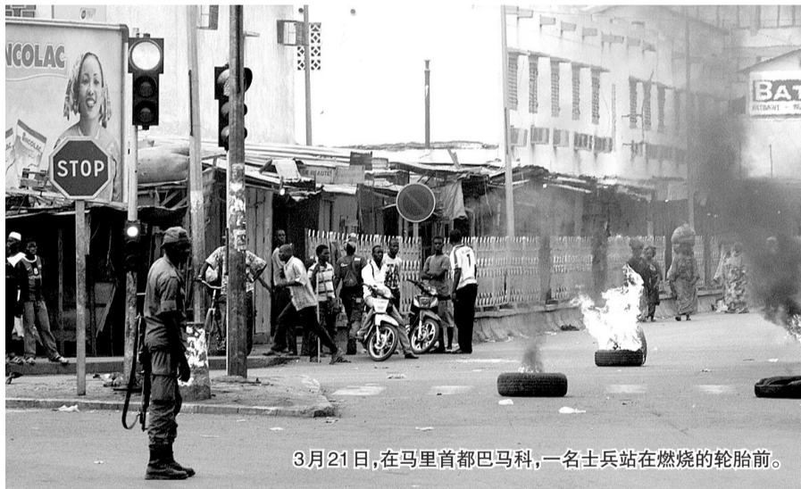
3月21日,在马里首都巴马科,一名士兵站在燃烧的轮胎前。