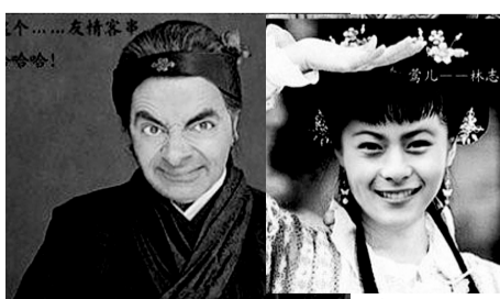
▲刘姥姥——憨豆先生 ▲莺儿——林志颖