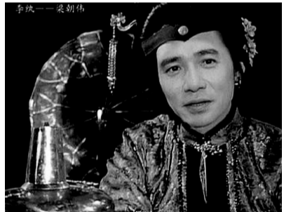
▲元春——黄海冰 ▲李纨——梁朝伟