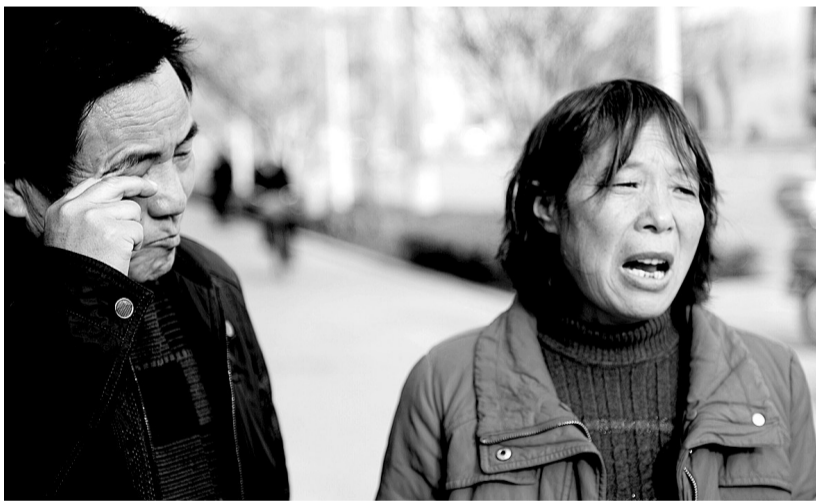
想起丢失的钱,夫妻俩很是心疼。

李警官说:“这属于丢失物品,不能立案。就算拍下拿包女孩的样子,也不太好寻找,因为汽车票不像火车票一样实名制,女孩没有留下任何信息。不过,我们正在尽力寻找,也正联系客运公司,因为包是在车上丢的,希望客运公司承担部分损失。”