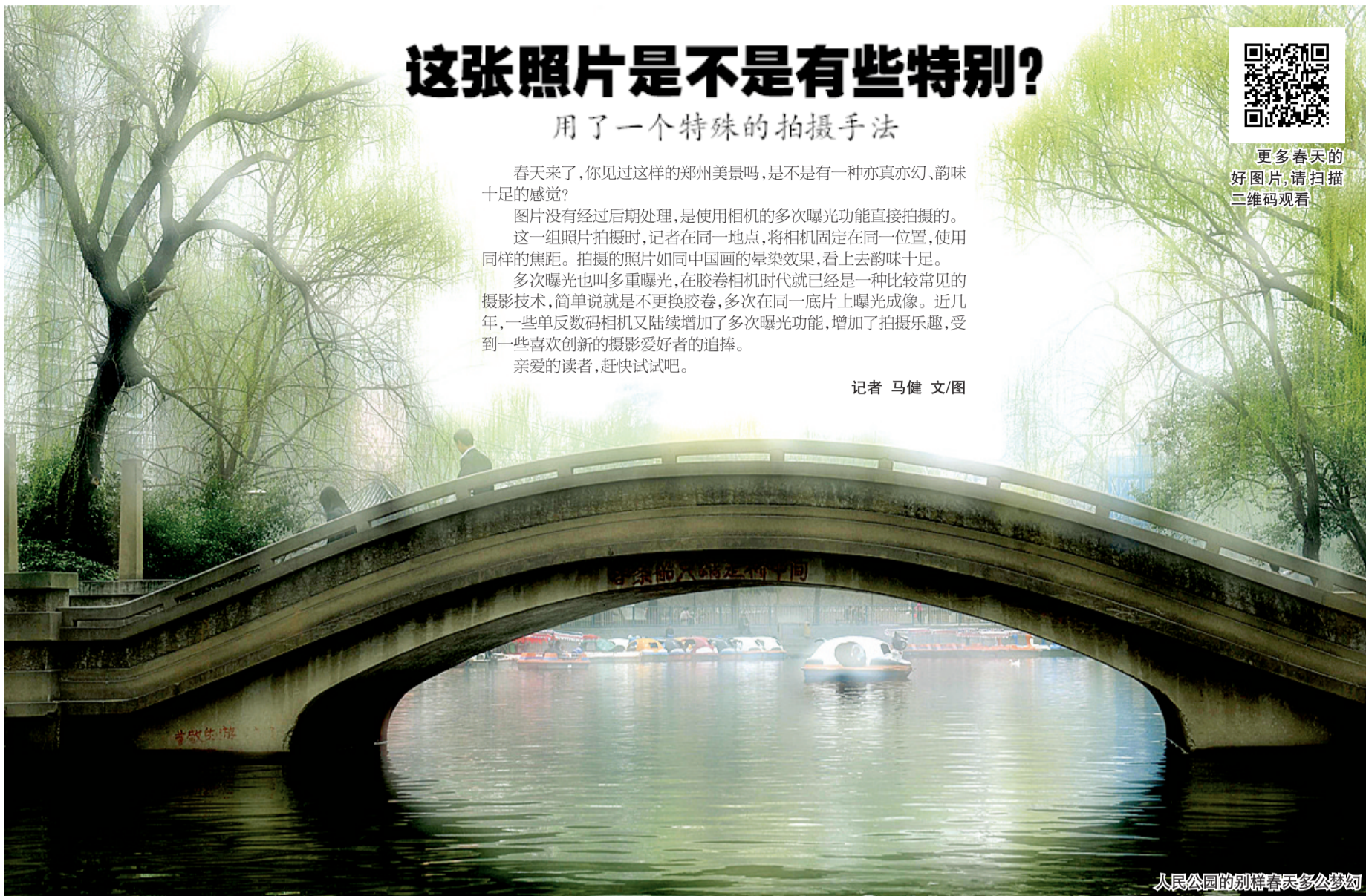
人民公园的别样春天多么梦幻