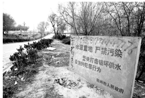
郑州市政府立的警示牌很容易被人忽视。

市环保局在去年8月提供的一份渔家乐消费高峰期保守数据显示:花园口附近的这些餐饮饭店日排污量达20吨。