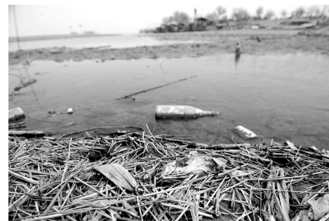
一处即将干涸的滩地上,一条死鱼躺在垃圾和饮料瓶旁边。

去年,市政府曾组织河务、农委、渔政、海事以及辖区政府等单位,召开了3次协调会,商议治理渔家乐船只。虽然市里曾出台文件,明确渔家乐船只归渔政部门管理,但截至目前,实际运行中的监管责任划分,仍不清晰。