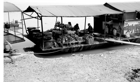
一个渔家乐直接在船上生火做饭。

3月28日,花园口段就发生一起险情,一艘渔家乐铁船失去动力,随水流向下游漂去。一艘水文测报船发现险情后,迅速上前将铁船拖送至岸边,才避免花园口黄河浮桥被撞。