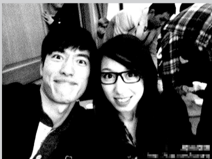
刘翔一直很照顾小师妹王丽

到截稿为止,帖子转发率依旧很高。众多网友纷纷追问,他俩真是一对吗?很显然,该帖子纯属一则愚人节恶作剧。刘翔父亲刘学根面对媒体曾表示:“刘翔现在还是单身,我们作为他的父母,以前也确实很焦急,特别是他妈妈。我还好几次专门问他,可他总说不急不急,我们现在也淡定了。”希望此事不要影响刘翔备战伦敦奥运会!