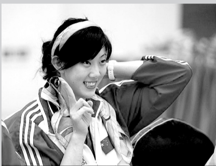
女排姑娘薛明也曾与刘翔传出绯闻

在此文中,作者运用新闻消息的写法,“报道”了其参加一场“突如其来”的刘翔“新闻发布会”时获得的惊人消息,文章引用“刘翔的讲话”,称“我与冬日娜在2006年就已经确定了恋爱关系……考虑到冬冬的压力和自己内心的愧疚,在征得家人、孙指导和有关领导的同意后,决定承担起一个男人的责任,给冬冬一个公平的对待!”全文中,作者运用了许多观察到的“细节”、氛围的铺排,“刘翔与冬日娜间”“眼神、动作之交流”,甚至“记者的反应”,孙海平指导的“态度”等等,勾勒了一场完整、几欲乱真的发布会现场。