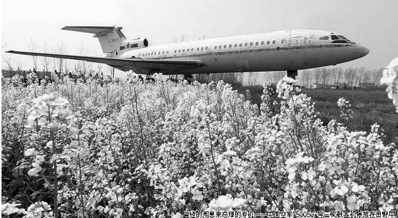
曾经的周恩来总理的专机——中国空军“5005”号三叉戟客机停放在田野中

这架飞机是20世纪60年代从英国进口的大型喷气式客机，改装后成为新中国第一代政府专机。周总理曾经乘坐它飞遍祖国大江南北，出访过朝鲜、越南、蒙古等十几个国家。20世纪80年代，这架飞机退役