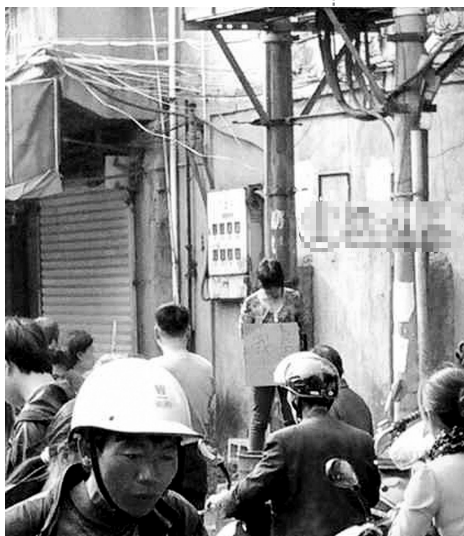
妇人被挂上“我是小偷”的牌子。