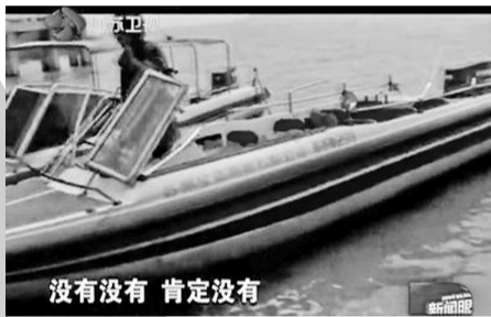
没有没有 肯定没有