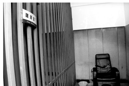
醒酒室: 醉酒者将由非常宽的约束带束缚在倾斜的沙发座椅上, 方便其醒酒, 一旁放置着垃圾篓。