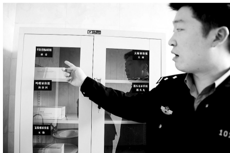
毒品检测室: 这里是嫌疑人专用卫生间, 内置有毒品检测柜。如有吸毒违法人员, 具有毒品检测资格的民警可在此进行分门别类的检测、建档。常见的毒品, 在此均可进行检测。