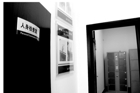
人身检查室: 民警对违法嫌疑人进行人身安全检查, 中间有隔板隔离。嫌疑人可保护自己的隐私, 涉案物品与个人物品分放在两个筐内。