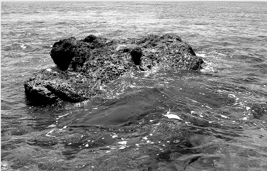
黄岩岛是中国南海中沙群岛中唯一露出水面的岛屿。东距菲律宾苏比克湾约126海里,四周为距水面半米到3米之间的环形礁盘。礁盘外形呈等腰直角三角形。内湖东南端有一个宽400米的通道与外海相连,中型渔船和小型舰艇可由此进入从事渔业活动或者避风。黄岩岛位于北纬15°07',东经117°51',行政管辖属于中国海南省西南中沙群岛办事处。