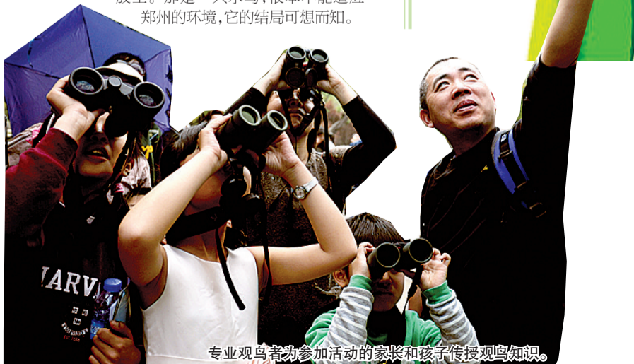
专业观鸟者为参加活动的家长和孩子传授观鸟知识。

他见过一个人在北闸口买了一只鸟,到碧沙岗公园放生。那是一只水鸟,根本不能适应郑州的环境,它的结局可想而知。