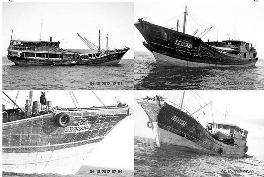
黄岩岛部分中国渔船，目前都很安全