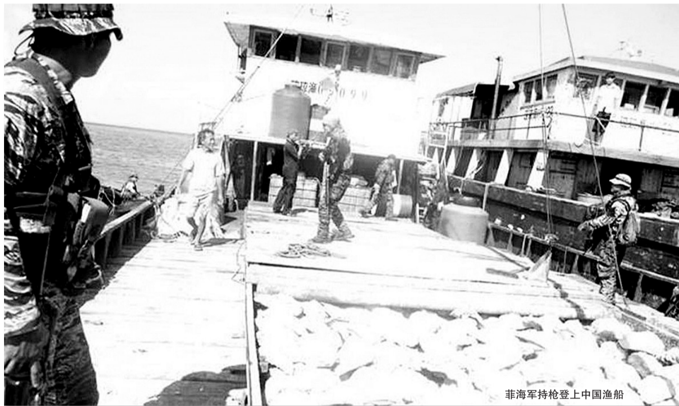
菲海军持枪登上中国渔船