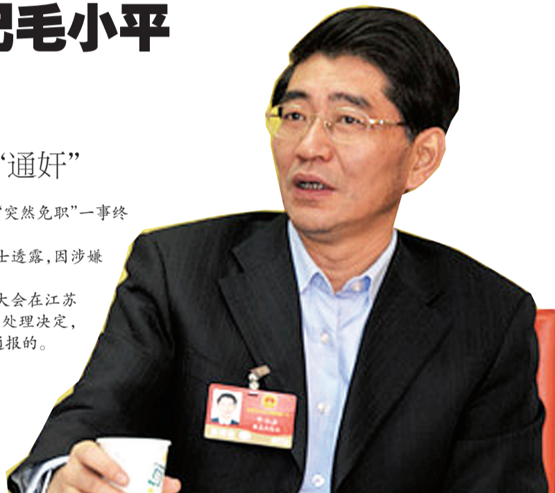
无锡原市委书记毛小平(资料图片)