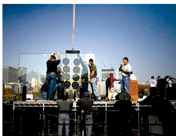
在奥巴马发表演说前，安保人员在台上两端各架设一块3.6米高、7.6厘米厚的巨型防弹玻璃。(2008年11月3日，芝加哥。)