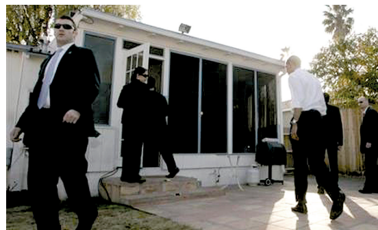
▲ 洛杉矶，保安护送奥巴马进入一栋住宅。