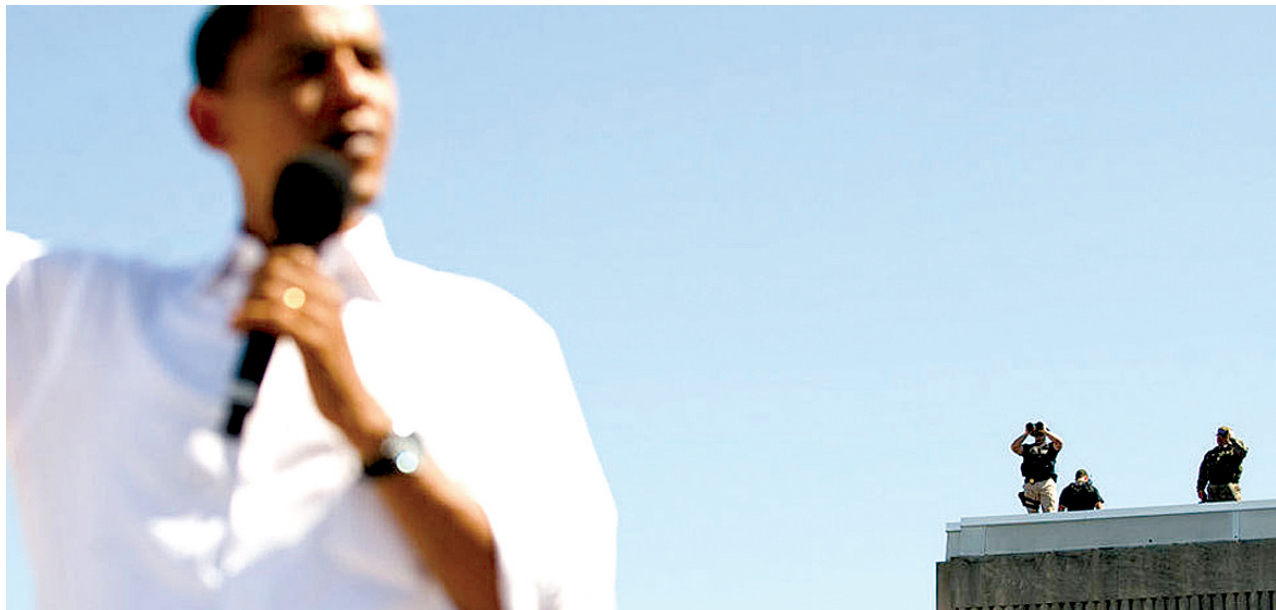
2008年8月31日，美国俄亥俄州，奥巴马为竞选作宣传，特工在附近的屋顶观察。