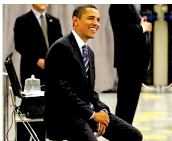
奥巴马用过的水杯会立即销毁，以防有人获取其DNA。(摄于北卡罗来那州达勒姆)