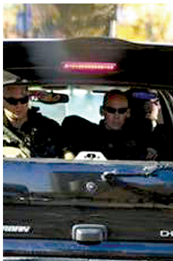
随行特工严密监视路况。奥巴马就任总统后，每次出行都有12辆一模一样的车同时驶出白宫，以混淆刺客的视听。