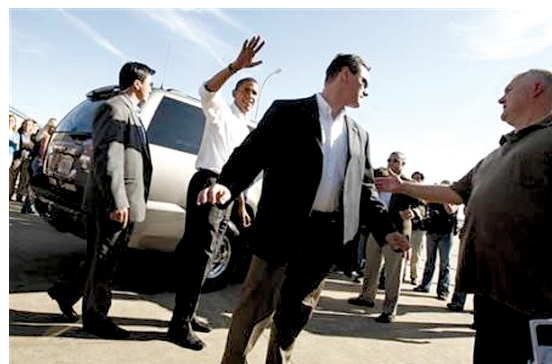
▲ 俄亥俄州柏瑞斯伯哥，特工阻止一名欲与奥巴马握手的男子(右)接近。 ◀ 2008年9月4日，美国宾州Lancaster，奥巴马参加竞选集会，特工在附近用望远镜监视情况。