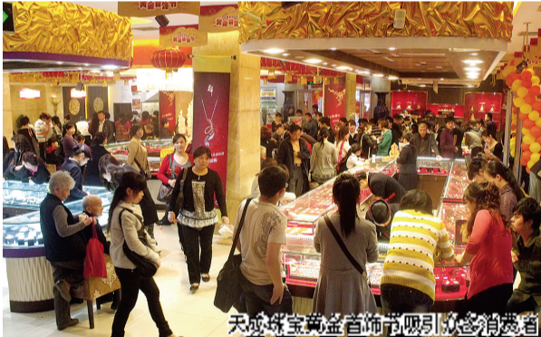
天成珠宝黄金首饰节吸引众多消费者

天成珠宝,前身是久负盛名四大老字号之一的老天成金店,已有近百年的品牌历程,历经风雨,如今已是中原珠宝首饰领头羊。4月21日,天成珠宝开封大商新玛特店、大润发店开业,天成珠宝第五届黄金首饰节也于当天启幕,活动持续5天。届时,天成珠宝将推出一系列价格优惠活动。 记者 熊维维