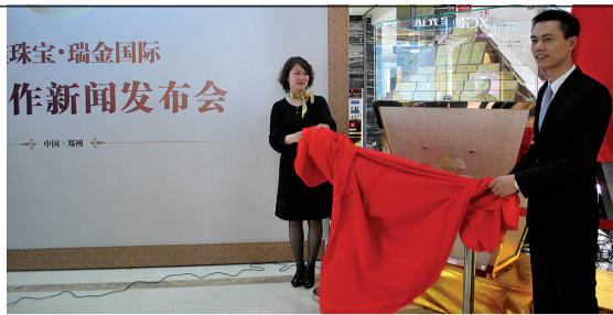
珠宝·瑞金国际 作新闻发布会

4月18日,金鑫珠宝集团携手“中国黄金投资理财第一家”、“全球铂金投资理财第一家”——瑞金国际,在金鑫珠宝正弘店隆重发布瑞金国际黄金投资金银条、金种子、铂金等投资理财产品及金鑫珠宝金益德黄金提货卡。发布会上重达两吨的金山银山,亮点纷呈的投资产品、全国首现的铂金投资产品、引领全新黄金消费模式的金益德黄金卡等诸多焦点吸引了众多消费者,标志着金鑫珠宝和瑞金国际在中原地区开启了全新的黄金珠宝投资理财新模式。 记者 熊维维