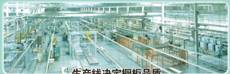
生产线决定橱柜品质