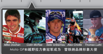
Mike Doohan Colin McRae Sete Gibernau Alex Criville Thomas Luthe Moto GP和越野拉力赛冠军成为雪铁纳品牌形象大使