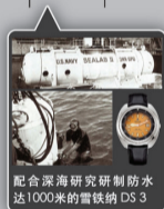
配合深海研究研制防水达1000米的雪铁纳DS3