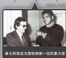
拳王阿里成为雪铁纳第一位形象大使