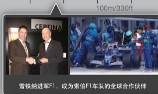
雪铁纳进军F1,成为索伯F1车队的全球合作伙伴