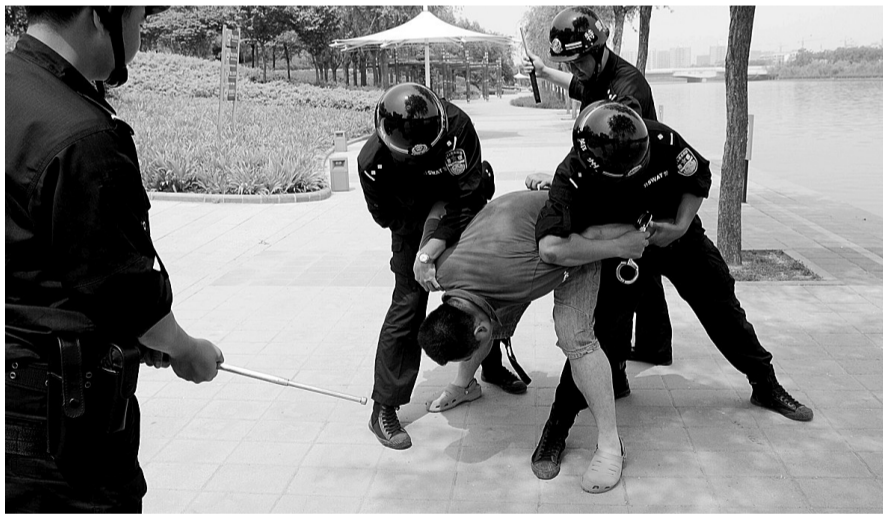
演习中,特警快速抓获了“抢包”男子。