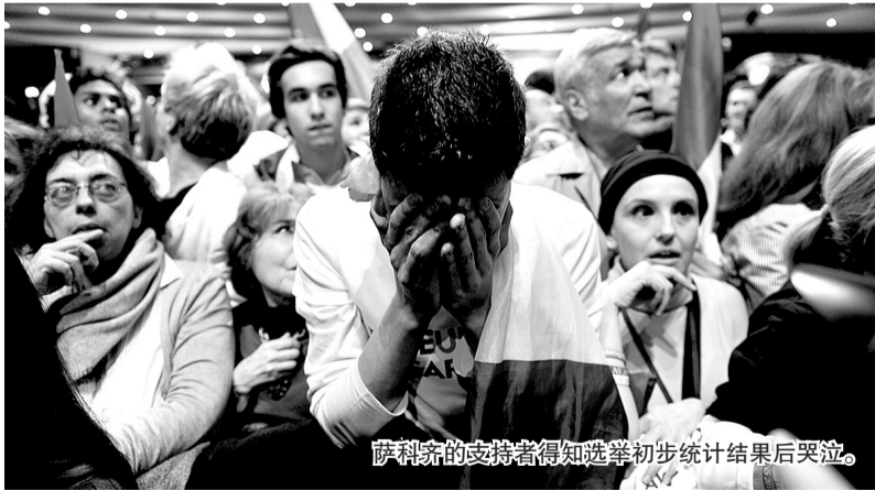
萨科齐的支持者得知选举初步统计结果后哭泣。