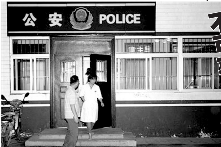
一名医护人员从北京一医院内的警务工作站走出。