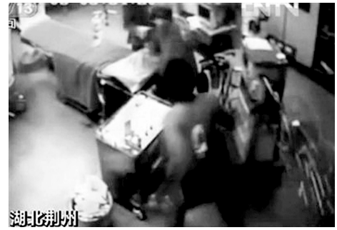
男子拎起手术室内的椅子砸向医生,开始不停追打。视频截图