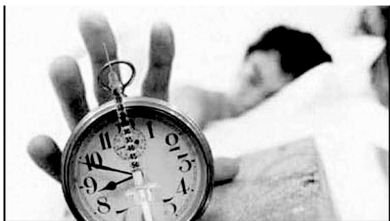
赖床是很多人的“通病”。(资料图片)

6日下午2点40分左右,浙江金华婺城警方接到一名男子报警,称其妻子把自己的亲生儿子杀死了。