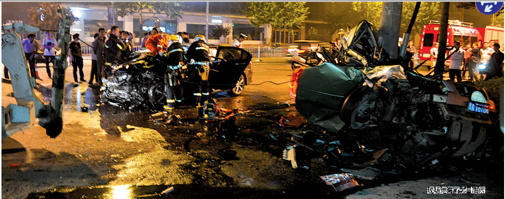
现场进行了火灾推后