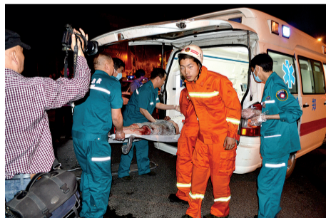
“讴歌”司机被救出来了