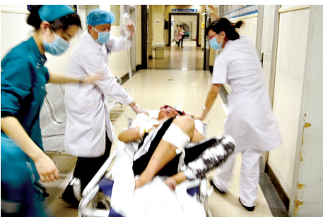
一名伤者接受治疗