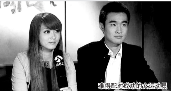
难得配对成功的女运动员