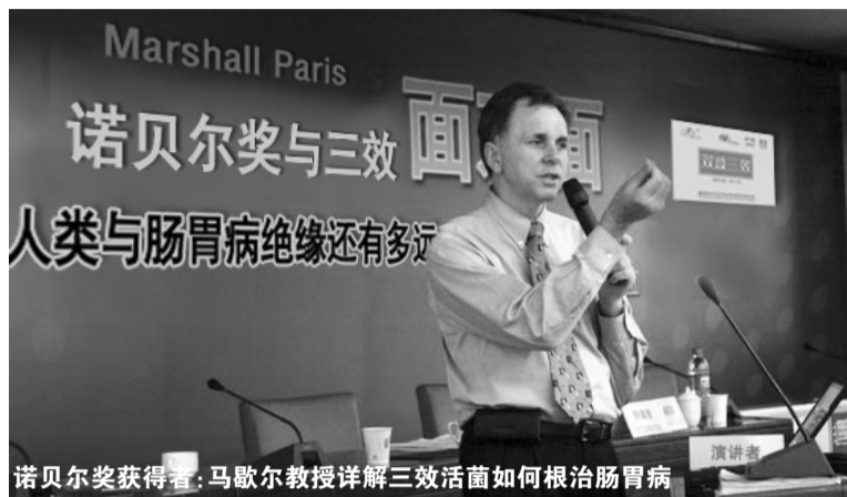
诺贝尔奖获得者:马歇尔教授详解三效活菌如何根治肠胃病