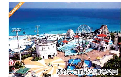
紧邻大海的花莲海洋公园

河南中原国际旅游集团:宝岛台湾全景环岛八日修学夏令营,在促进海峡两岸学生交流的同时,参观台北故宫博物院、台中自然科学博物馆、九族文化村、日月潭风景区、北回归线碑、花莲海洋公园、台北101大楼等,非常适合13~18岁学生参与。