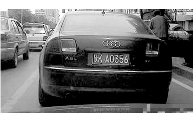
该车竟是一辆排量为3.2L奥迪A8轿车

5月9日,记者对陕西榆林市内悬挂市委、政府“陕KA”特殊牌照的车辆进行了跟踪暗访,结果发现,有不少单位超标配车。