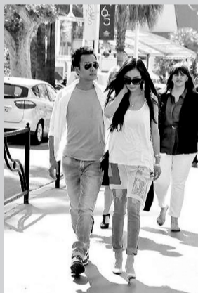
杨幂、刘恺威难得有甜蜜假期