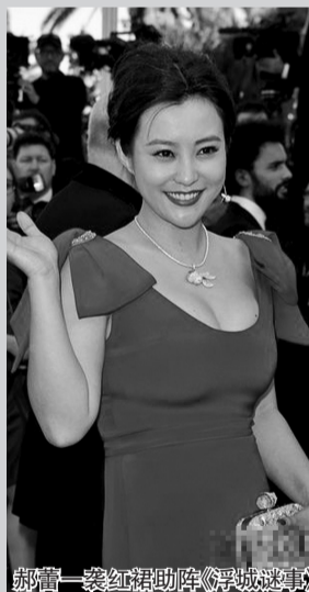
郝蕾一袭红裙助阵《浮城谜事》