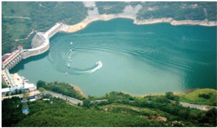
双峰捧月·中国奇湖